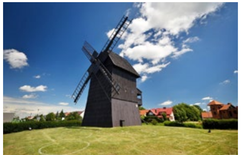
Wiatrak w Rydzynie

Zamek w Rydzynie często odwiedzają turyści z odległych stron. Okazuje się jednak, że ten wyjątkowy zabytek nie cieszy się szczególną popular-