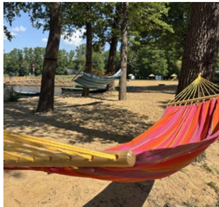
■ Hamaki na letniku w Osiecznej

II wojnie światowej pałac przeszedł w ręce Państwowego Gospodarstwa Rolnego i stał się miejscem, gdzie organizowano letnie kolonie. Nowi właściciele pod koniec XX w. wyremontowali pałac i jego otoczenie przywracając mu dawny blask. Zespół pałacowo - dworski otacza imponujący park krajobrazowy pochodzący z końca XVIII w.