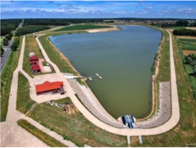
■ Zalew w Rydzynie z lotu ptaka.

owników i ogrodników, którzy opiekowali się parkiem. Zamek Królewski posiada projekt modernizacji tych miejsc, ale mówimy tu o milionach złotych. Jesteśmy w kontakcie i mam nadzieję, że zmiany uda się przeprowadzić.