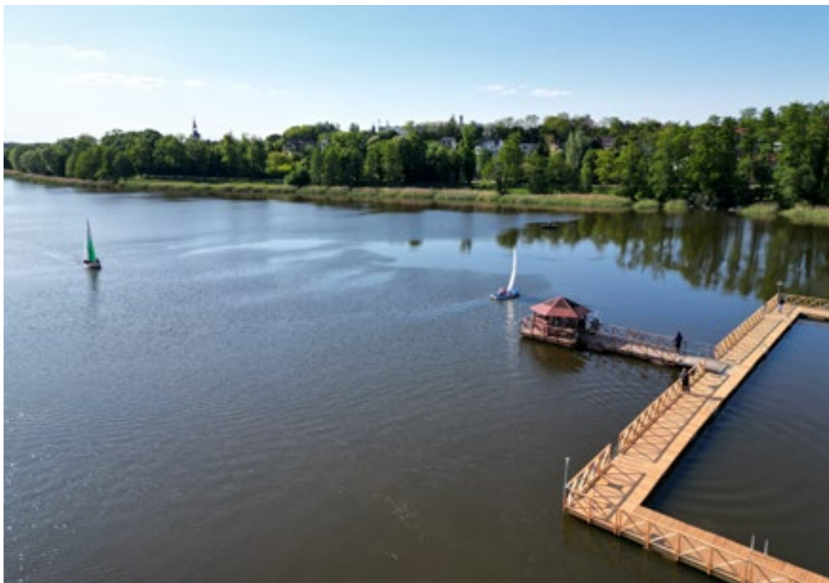
■ Jezioro Łoniewskie

Na pewno chcemy pozbyć się krzaków z niektórych miejsc. Prowadzimy już działania w tym kierunku. Planujemy też rozbudowę alejek wewnętrznych.