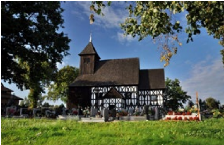
Kościół w Dąbczu