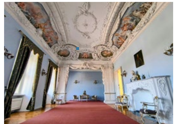
■ Wielka Alkova w Zamku Królewskim w Rydzynie