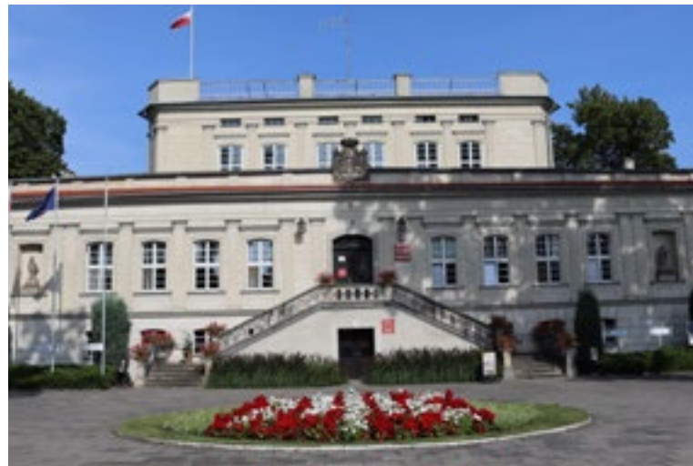
■ Pałac we Włoszakowicach

Rzeczywiście takich wydarzeń jest sporo. Na szczególne wyróżnienie zasługują obchody Święta Niepodległości 11 listopada. Jednym z ich najbardziej widowiskowych elementów jest przejazd kawalerii konnej. Dużym wydarzeniem są także Dni Gminy Włoszakowice. To impreza dwudniowa – sobota jest skierowana głównie do dorosłych, natomiast niedziela przygotowywana jest przede wszystkim z myślą o najmłodszych. Na stałe w kalendarz wydarzeń wpisał się również grudniowy Korowód Światła. Nie brakuje także imprez sportowych, takich jak Bieg Sokoła, który przyciąga biegaczy z całej Polski. W tym roku odbędzie się już jego czterdziesta edycja, co pokazuje, jak duże doświadczenie mamy w organizacji tego wydarzenia. Dużym zainteresowaniem cieszą się również tradycyjne wianki oraz zawody żeglarskie.