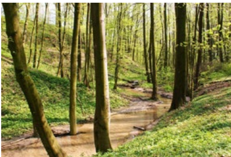
■ Jaworowy Jar

Jest sporo obiektów prywatnych, które świadczą usługi hotelowe. Mamy też schronisko młodzieżowe dysponujące kilkudziesięcioma miejscami noclegowymi. Można tam wypocząć w naprawdę dobrych warunkach. To ważny element naszej bazy noclegowej, bo pobyt w nim jest tani. Ma ono niezwykle atrakcyjne położenie, które zapewnia widok na jezioro i jego bliskość. Schronisko oferuje również wyżywienie i wycieczki do interesujących miejsc. Od niedawna schronisko to funkcjonuje na platformie Booking tak, aby ten zasięg i możliwość skorzystania były jak największe.