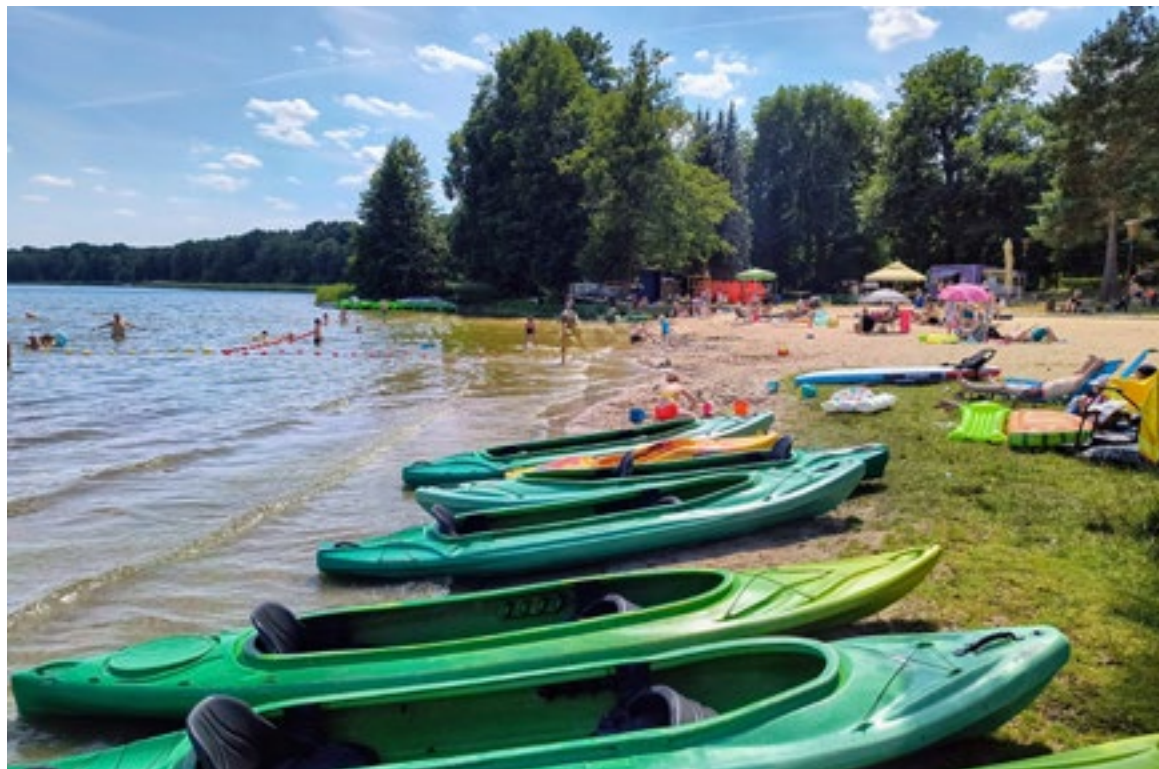
■ Plaża ośrodka Krokus w Wieleniu

Ośrodek Wypoczynkowy Krokus w Wieleniu to miejsce, w którym aktywny wypoczynek łączy się ze zdobywaniem nowych umiejętności, nauką współpracy w grupie i świetną zabawą. Oferta zajęć rekreacyjnych jest bogata i różnorodna, tutaj każdy znajdzie coś dla siebie.